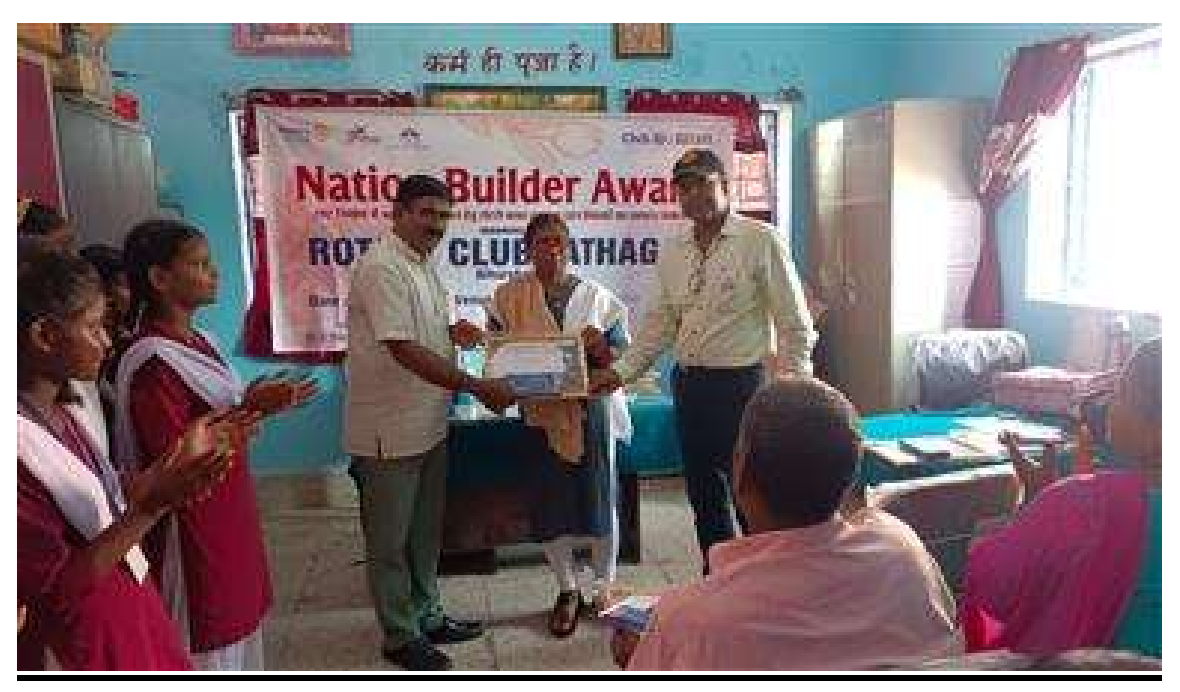
Nation Builder Award 7 (Simaraour)